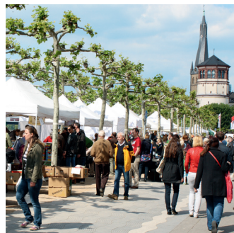
Die über die Grenzen hinaus bekannte Büchermeile am Rhein.