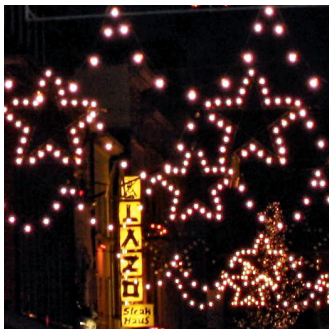
Stimmungsvolle Winterbeleuchtung in den Gassen und Straßen der Altstadt/Carlstadt.

„Die lange Tafel“ zur Mittsommernacht: Urlaubsstimmung direkt am Rhein.